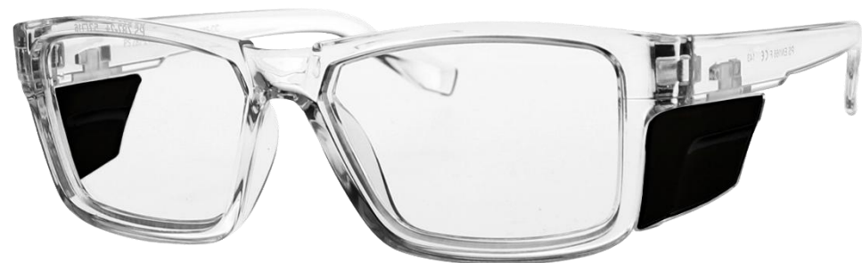
RG-T9538S-CC[クリスタルクリア]