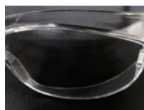
DRV-200/ アルコール洗浄 30 回後

※消毒用エタノールを脱脂綿で塗布⇒水洗い後ティッシュで拭き上げ呼吸をあてる⇒50回OK 当社調べ